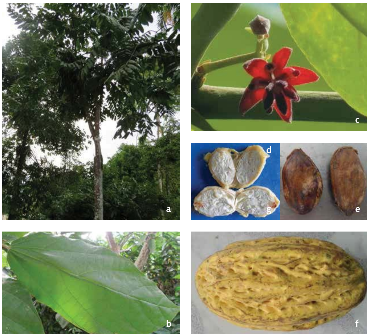
FIGURA 3. PRINCIPALES CARACTERÍSTICAS MORFOLÓGICAS OBSERVADAS EN MATERIALES DE T. BICOLOR EN CAQUETÁ. A. ARQUITECTURA DEL ÁRBOL. B. MORFOLOGÍA FOLIAR. C. ÓRGANO FLORAL. D. COLOR INTERNO COTILEDÓN. E. ALMENDRAS. F. MORFOLOGÍA DEL FRUTO.

partir de un gráfico biplot se analizó la relación entre materiales y descriptores morfoagronómicos cuantitativos. Se realizó un análisis de conglomerados para conformar grupos y analizar las similitudes entre los diferentes materiales con base en los descriptores morfoagronómicos cuantitativos y cualitativos. Finalmente mediante un análisis procrustes se determinó el grado de consenso entre los datos de las variables cuantitativas y cualitativas. Las pruebas estadísticas se corrieron en el programa InfoGen versión 2012 (Balzarini y Di Rienzo 2012).