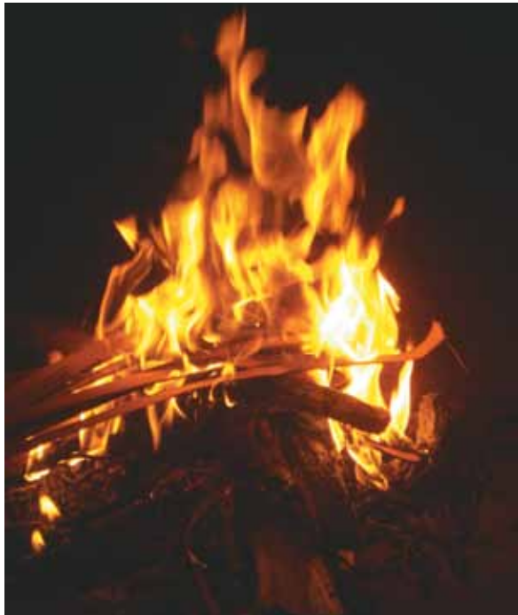
Iluminación con turi ( Eschweilera rufifolia )

El hecho de consumir leña para producir luz o calor fundamentales para el desarrollo de la vida, ha permitido que permanezcan en excavaciones arqueológicas restos de madera carbonizada. Es así como, el uso del fuego se documenta en yacimientos arqueológicos