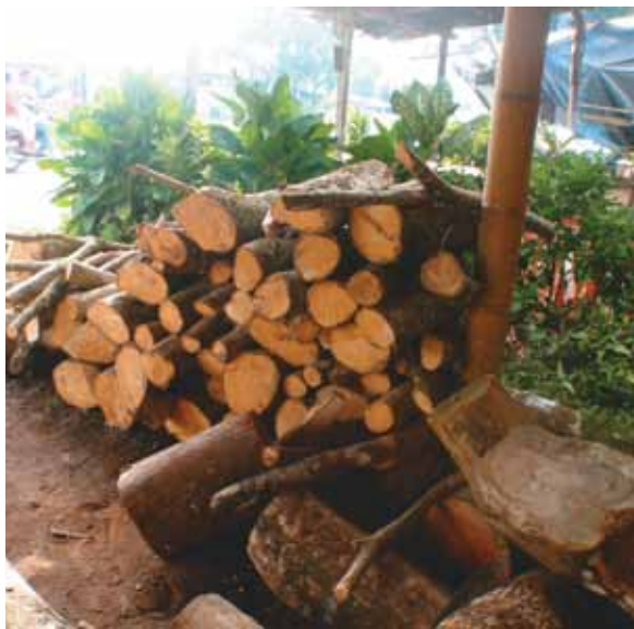
Arrume de leña

“También al incienso lo utilizaron para iluminar como lámparas las malocas en la celebración de ceremonias y fiestas tradicionales, muchas veces los adultos lo usaban para iluminar en la preparación del mambe, para la reflexión de ciertos problemas cosmogónicos y comunicación con los seres de la naturaleza”.