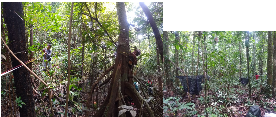
Figura 1. Instalación de parcelas para el levantamiento de información biológica, ecológica y productiva.