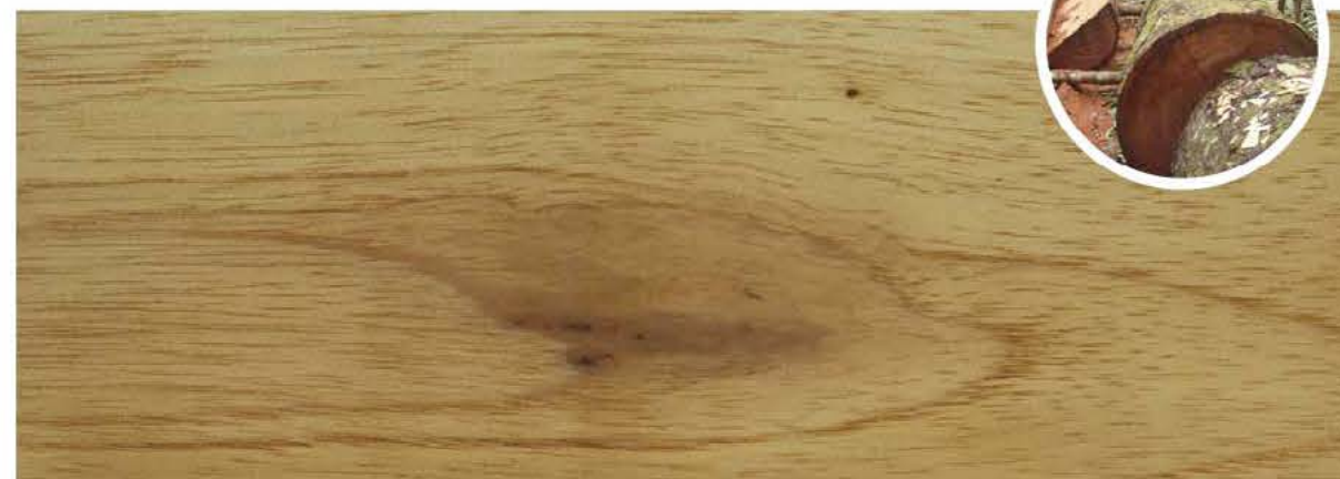
Corte de madera de cedro