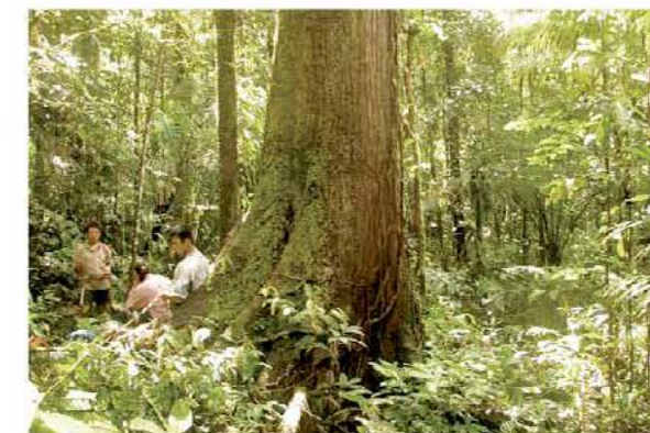
Árbol con contrafuertes