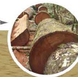
Trozas de cedro

raramente atacada por termitas. Se reporta como fácil de secar tanto al aire libre como en horno. El cedro es apropiado para chapa plana ya que se desenrolla fácilmente, también para muebles finos, usos navales botes, instrumentos musicales, artesanías, talla y empaques lujosos