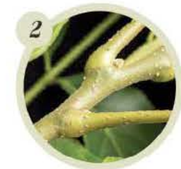
ENGROSAMIENTO DE LA BASE DEL PECÍOLO